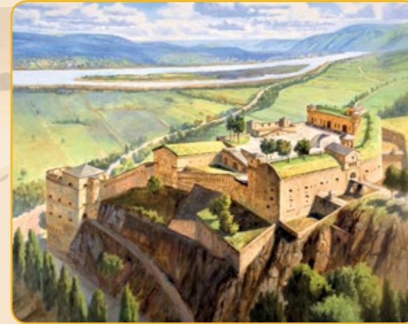
Auf einem im Jahr 2007 geschaffenen Gemälde rekonstruiert Anton Baecker das Fort um 1865

Unmittelbar bevor das Rheinland an Preußen fiel, erteilte der preußische König Friedrich Wilhelm III. am 11. März 1815 die „Order zur Neubefestigung der Stadt Coblenz und der Festung Ehrenbreitstein“. In den folgenden Jahren entstand eines der umfangreichsten Festungssysteme Europas. Darunter auch das in den Jahren 1822 bis 1827 erbaute Fort Großfürst Konstantin, benannt nach dem Bruder des russischen Zaren, Konstantin Pavlovich.