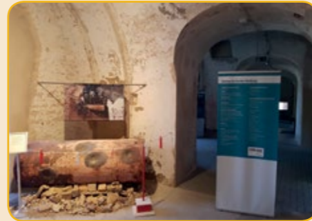
Luftmine, die am Pfingstmontag 1999 auf dem Gelände der Universität in Koblenz-Metternich entschärft wurde.

In den nördlichen Kasematten, die 1944 mit einem Bunker überbaut wurden, ist seit 2015 die Ausstellung „Koblenz im Zweiten Weltkrieg“ untergebracht – zurzeit die einzige stadtgeschichtliche Ausstellung von Koblenz. Sie wurde vom Stadtarchiv Koblenz konzipiert und ist jeweils in den Monaten Mai bis Oktober zu besichtigen.