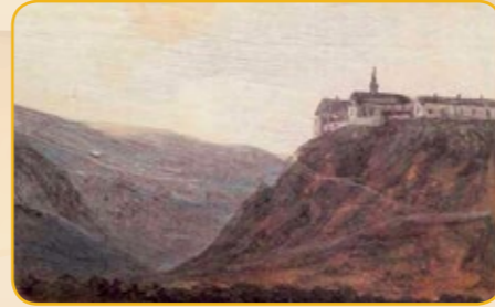
Ansicht des Kartäuserklosters ca. 1810 Unbekannter Maler: Vue de Coblenz, prise du côté de la Moselle (Privatsammlung)

Im Rücken des Hauptbahnhofs steigt der Schieferfels, auf dem das Fort errichtet ist, rund 60 m über der Stadt an. Es kann davon ausgegangen werden, dass das Gelände schon zur Römerzeit besiedelt war. Ebenfalls auf die Römerzeit geht eine ungesicherte Quelle aus dem Mittelalter zurück, nach der sich an dieser Stelle eine Gedenkstätte (Memoria) gefallener christlicher Märtyrer befunden habe.