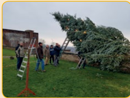
Aktive Vereinsmitglieder errichten jährlich einen Weihnachtsbaum.

Eine Besonderheit des Vereins PRO KONSTANTIN e.V. ist, dass man sich aktiv an der Erhaltung des Forts Konstantin beteiligen kann. Von der Pflege der Grünanlagen über Reparatur- und einfache Sanierungsarbeiten bis hin zu Elektroinstallationen, Schlosser- und Schreinerarbeiten – dies alles wird (je nach Größe der Aufgabe unterstützt durch entsprechende Handwerksfirmen) von den Vereinsmitgliedern gemeinsam angepackt und bewältigt. Ein besonderes, sehr nachhaltiges Gemeinschaftserlebnis!