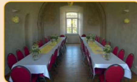
Kasematte 2 vorbereitet für die Nutzung durch eine Geburtstagsfeier