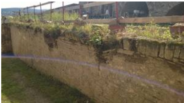
Mauerkrone vor der Sanierung

(HP) In der vorhergehenden Mitglieder-Information (Info 1505) wurde u. a. über die statische Sicherung der inneren Rampenmauer zwischen ehemaligem Pulvermagazin und unterem Hof berichtet. Dabei wurde auf die in Teilbereichen starken Schäden der Mauerkrone hingewiesen, die es notwendig machen würden, sie instand zu setzen bzw. zu sanieren. Diese Sanierung ist im September dieses Jahres im Auftrag und auf Rechnung von PRO KONSTANTIN erfolgt.