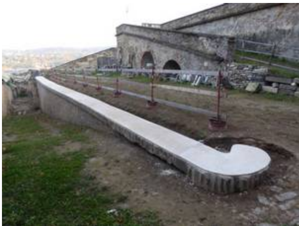
Sanierte und ergänzte Mauerkrone