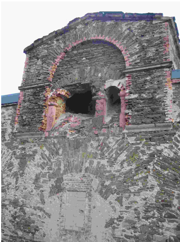
Außenfassade Kanonenaufzug Südflügel vor Restaurierung

Ende August dieses Jahres wurde das Baugerüst vor dem Südflügel des Kasemattengebäudes entfernt und machte den Blick frei auf die restaurierte Außenfassade des Kanonenaufzugs. Die Restaurierung der Außenfassade des Kanonenaufzugs über dem Haupttor war schon Ende Juni abgeschlossen. Im Vergleich vorher/nachher ist der Anblick auf die restaurierte Fassade des Kanonenaufzugs im Südflügel jedoch wesentlich spektakulärer als der auf die über dem Haupttor (wie die nachstehenden Fotos zeigen).